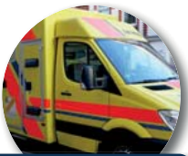
Erkunde das Zahnmobil