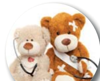
Hat dein Teddy Zahnschmerzen?