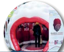
Gehe auf Entdeckungstour