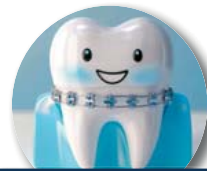
Hast Du das gewusst?