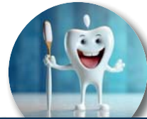
Behandeln wie eine/e Zahnarzt/ärztin